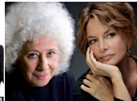
1. Silvio Orlando; 2. Alessandro Gassman; 3. Toni Servillo; 4. Sal Da Vinci; 5. Massimo Ranieri; 6. Vincenzo Salemme; 7. Arturo Brachetti; 8. Massimo Lopez e Tullio Solenghi; 9. Isa Danieli e Giuliana De Sio.

gennaio con "Insomnia", mentre Ennio Fantastichini e Iaia Forte porteranno dal 16 gennaio "Tempi Nuovi", scritto e diretto da Cristina Comencini. Dal 13 febbraio c'è Massimo Ranieri, con la pièce "Il Gabbiano" di Anton Cechov adattato e diretto da Giancarlo Sepe. Anche Vincenzo Salemme scrive, interpreta e dirige "Con tutto il cuore", sul palco dal 6 marzo, mentre a concludere questo calendario ci sarà Serena Autieri con Paolo Calabrese in "La Menzogna" di Florian Zeller per la regia di Piero Maccarinelli. Al Teatro San Ferdinando si parte il 7 novembre con Ficarra e Picone con "Le Rane" di Aristofane, che provano a far ridere con un testo di 2500 anni fa, mentre dal 26 dicembre lo scrittore Maurizio De Giovanni ci farà riflettere con "Il Senso del Dolore". Dal 28 marzo invece la terribile Scianel di Gomorra, Cristina Donadio, indaga le solitudini in "Festa al celeste e nubile santuario", mentre dal 26 aprile Massimiliano Gallo interpreta e reinterpreta la figura classica di Medea in "Medea di Portamedina".